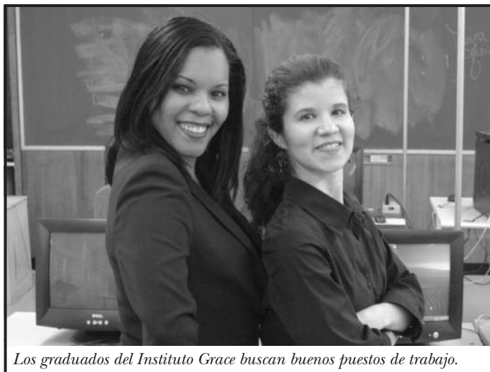
Los graduados del Instituto Grace buscan buenos puestos de trabajo.

FIRST STEP (Primer Paso) es el programa gratuito de la Coalición para las Personas Sin Hogar que capacita a las mujeres sin hogar a través de capacitación laboral actual, pasantías, tutorías, colocación en puestos de trabajo y servicios de apoyo social. ►